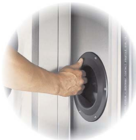
2. Inre handtag