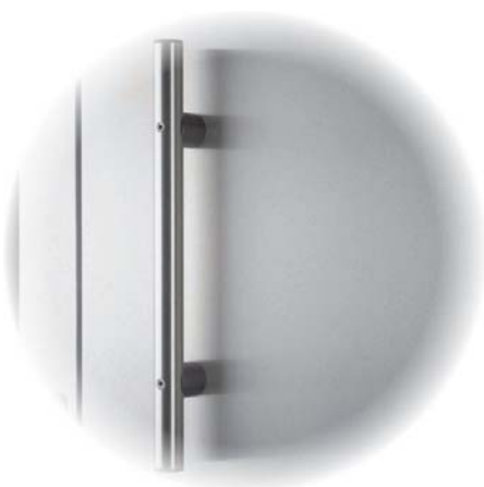
1. Yttre handtag