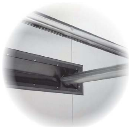
3. Urtag för glidstångsbana