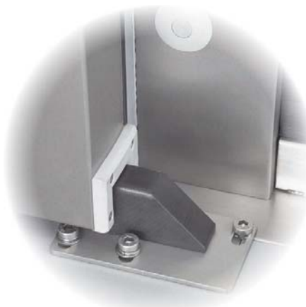
4. Botten styrnings profil